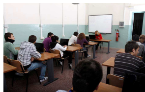
aula dotata di pc per ogni studente e LIM