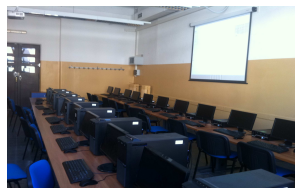
sala computer con 30 postazioni (realizzata con il contributo della Fondazione Roma)